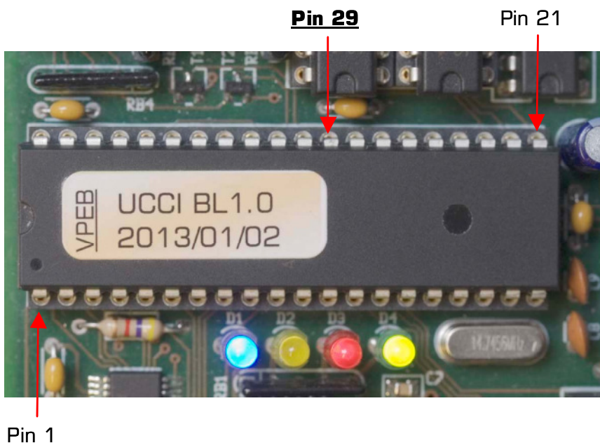
Fig 2: Pin 29 van de CPU