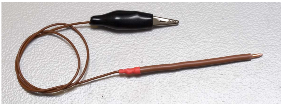
Fig 3: Testpen met krokodilleklem

Voor het draadje, om de CPU in Bootloader Mode te krijgen, kun je volstaan met een simpel geïsoleerd koperdraadje. Wil je het risico verminderen dat je per ongeluk kortsluiting maakt dan kun je beter het uiteinde dat je op de CPU-pin zet voorzien van een "stevig" uiteinde dat je goed kunt vasthouden. Zo'n "testpen" kun je eventueel zelf maken van een stukje geïsoleerd (230V) installatiedraad (ca 8 cm). Strip van één uiteinde een klein stukje isolatie (ca 8 mm) en vijl het uiteinde in een puntje. Strip van het andere uiteinde een klein stukje isolatie en soldeer hieraan een stukje soepel koperdraad. Zet bij voorkeur een stukje krimpkous over het soldeerpunt, zodat het weer geïsoleerd is. Wil je het jezelf helemaal gemakkelijk maken, maak aan het andere uiteinde van het koperdraadje een krokodilleklemmetje. Het geheel ziet er dan ongeveer uit zoals fig 3. Als je de "testpen" geruime tijd niet gebruikt hebt en je wilt 'm weer gebruiken, maak hem dan eerst even goed schoon door het puntje licht over een stukje fijn schuurpapier te halen.