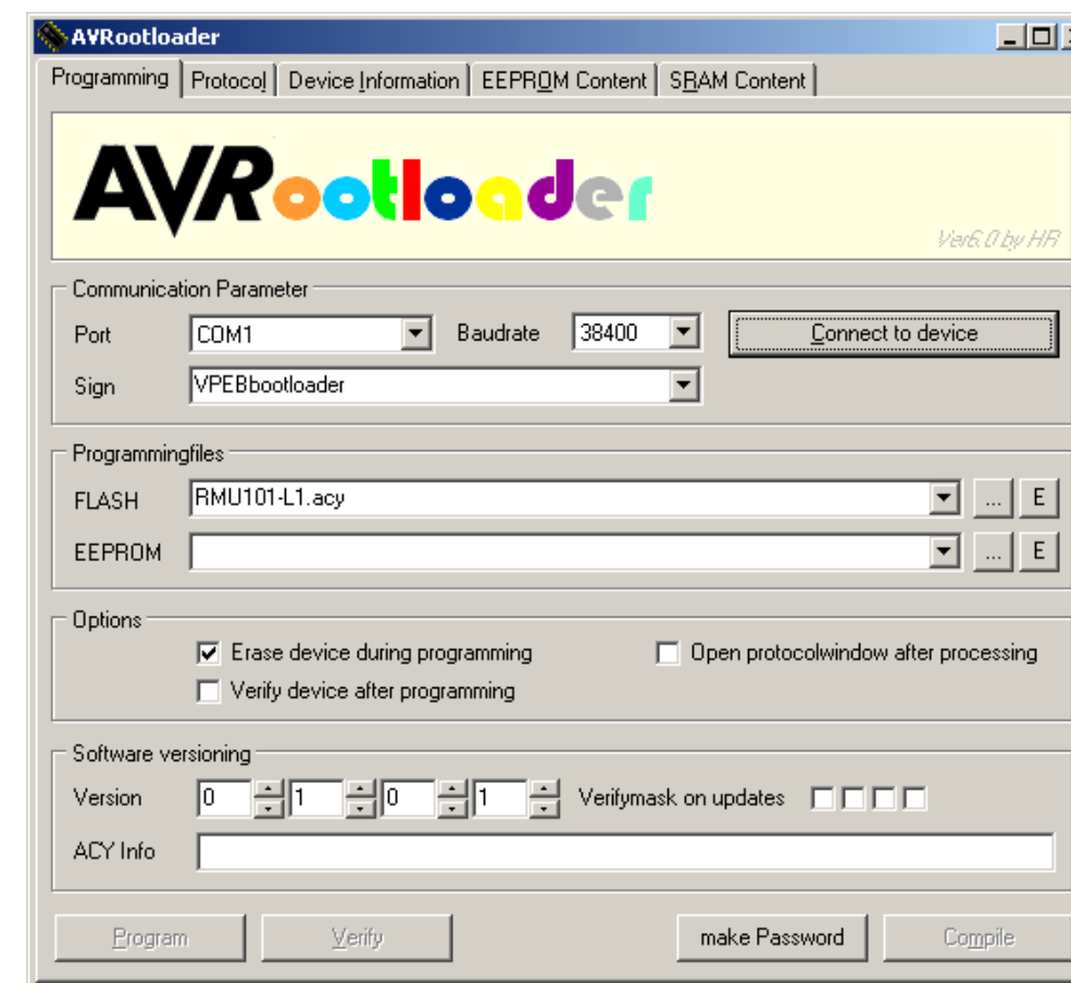
Fig 1: AVRrootloader